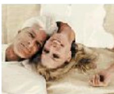
Der implantierbare Defibrillator lebenserhaltende Therapie

Herz aus dem Takt Sendungen Nov. 2007 Zur Ansicht wird der Windows Media Player benötigt. Teil 1 vom 1. November 2007 Teil 2 vom 8. November 2007 Teil 3 vom 5. November 2007 mit freundlicher Genehmigung des Hessischen Rundfunks!